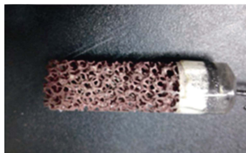
c 电解氯化后的 CF/Ag 形成 Ag/AgCl 层