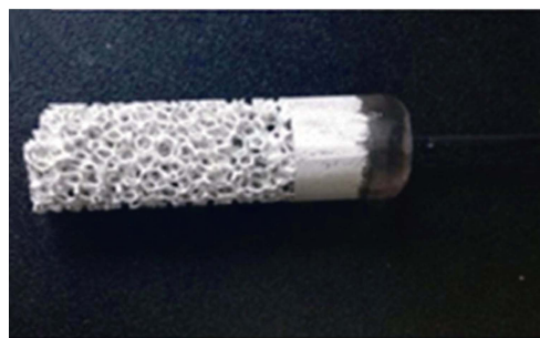
b CF 化学镀银后